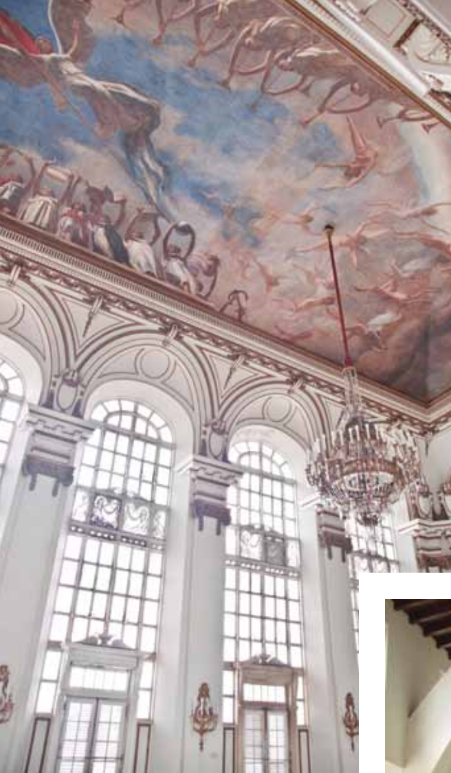
El techo del "Salón de los Espejos" en el Palacio Presidencial fue decorado en el 1920 con un mural alegórico creado por el pintor cubano Armando Menocal