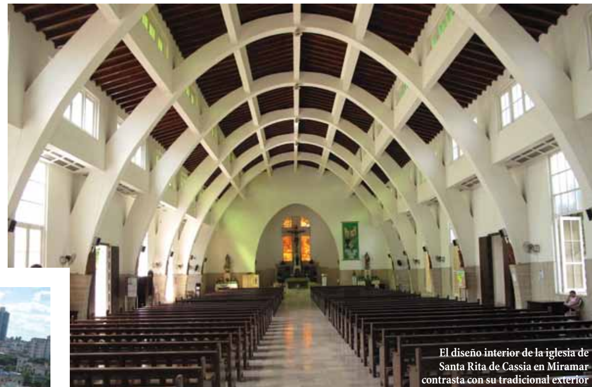
El diseño interior de la iglesia de Santa Rita de Cassia en Miramar contrasta con su tradicional exterior