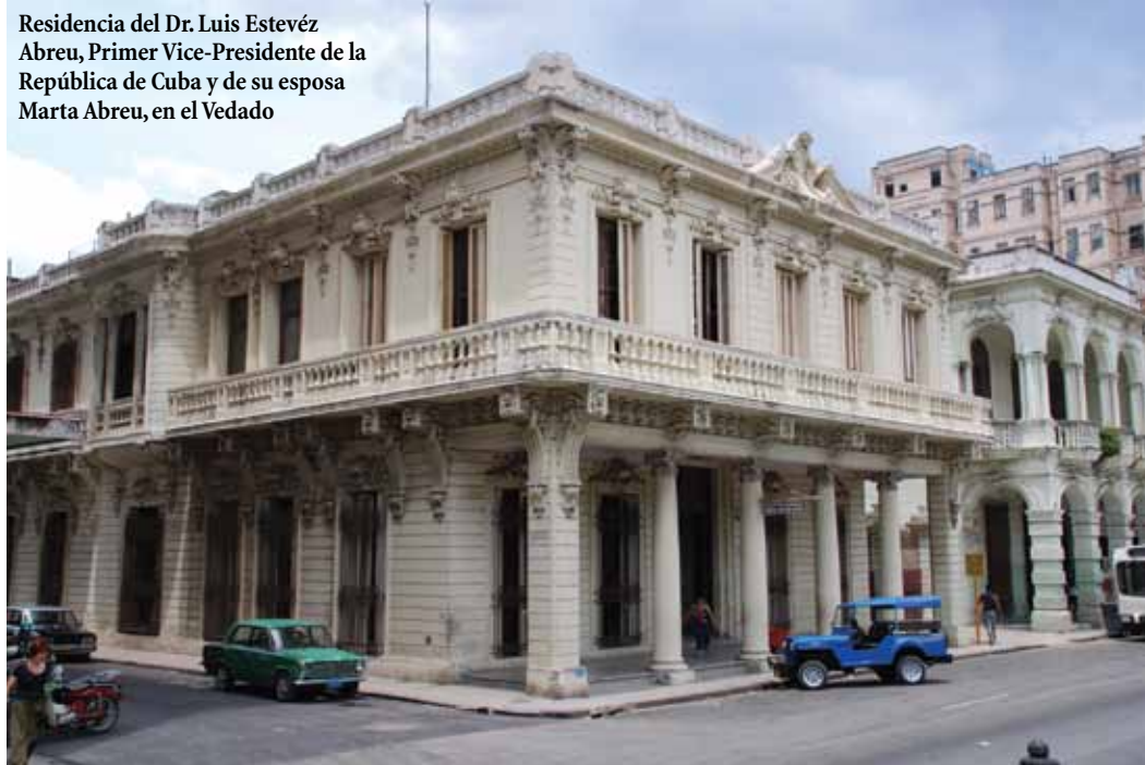
Residencia del Dr. Luis Estevez Abreu, Primer Vice-Presidente de la República de Cuba y de su esposa Marta Abreu, en el Vedado