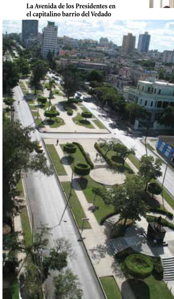
La Avenida de los Presidentes en el capitalino barrio del Vedado

existían tantas muestras de los estilos más importantes del siglo XX. Deseaba lograr algo distinto, pues los libros que existen sobre Cuba siempre muestran el periodo colonial, muebles antiguos o el deterioro de los edificios. Esta es la primera vez que no solo se muestra una residencia, sino su contexto social con historias de las personas que vivieron allí. Otros libros pictóricos muestran simplemente fotos con una pequeña reseña, y otros están dirigidos a la historia arquitectónica exclusivamente, sin tocar el tema de sus residentes, ni lo que éstos vivieron allí. En mi trabajo yo hablo sobre el estilo de vida sofisticado que prevaleció en la Habana desde 1860 hasta 1960, destacando la vida de los artistas, playas, tiendas, cabarets y colegios. A través del libro, llevo al lector a conocer "desde adentro", a esta bella ciudad.