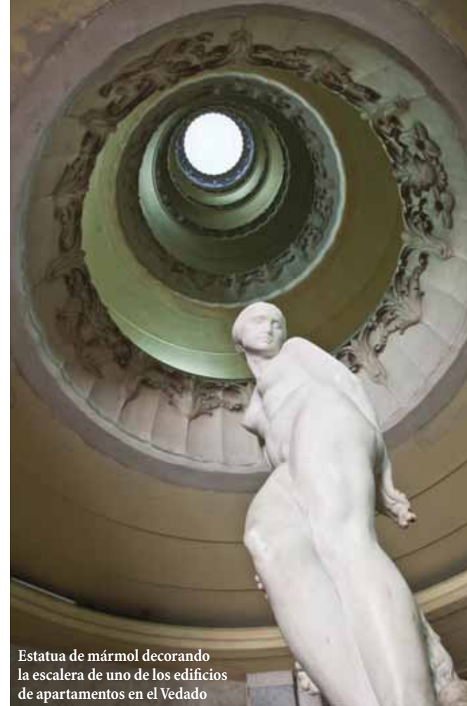
Estatua de mármol decorando la escalera de uno de los edificios de apartamentos en el Vedado

bre los detalles de esta bella publicación, justo antes que saliera de viaje para la India, donde presentó el libro en varias ciudades. Arquitecto de profesión, en 1983 este talentoso caballero fundó en Nueva York la firma M Group junto a Carey Malone, destacado diseñador de interiores, la cual rápidamente se convirtió en una de las más importantes de la ciudad. Sus proyectos han aparecido en reconocidas publicaciones de la talla de Architectural Digest , House Beautiful y New York Magazine , destacándose inclusive como una de las 100 firmas más importantes de la nación. Hoy, éste agrega a su lista de logros el lanzamiento con gran éxito de este libro, ya que "Great Houses of Havana" ha sido presentado, no solo en diferentes