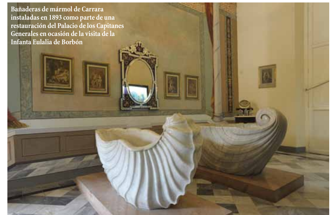
Bañaderas de mármol de Carrara instaladas en 1893 como parte de una restauración del Palacio de los Capitanes Generales en ocasión de la visita de la Infanta Eulalia de Borbón

Fue el resultado de mis peculiares actividades turísticas, algo que hago regularmente cuando visito una nueva ciudad... camino por sus calles tomando fotos de su arquitectura. Yo sabía que en la Habana había casas magníficas de los siglos XVII y XVIII, pero no estaba al tanto de que ▶