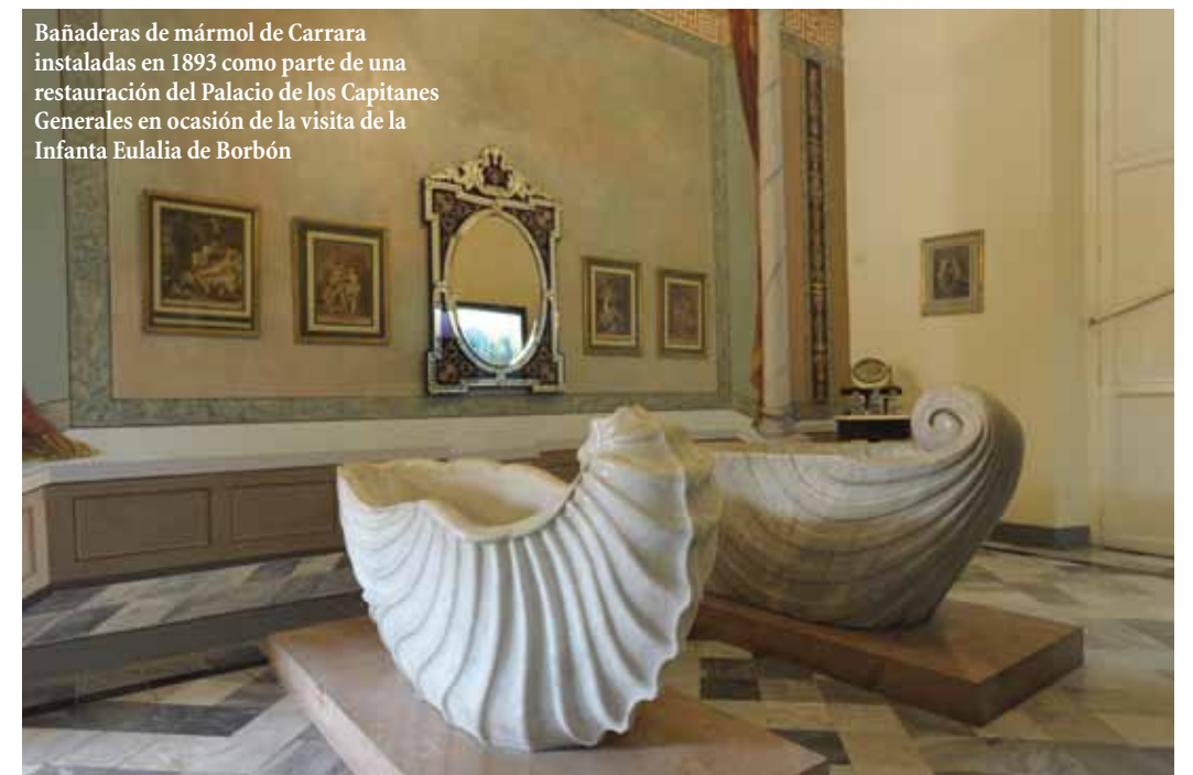
Bañaderas de mármol de Carrara instaladas en 1893 como parte de una restauración del Palacio de los Capitanes Generales en ocasión de la visita de la Infanta Eulalia de Borbón

Fue el resultado de mis peculiares actividades turísticas, algo que hago regularmente cuando visito una nueva ciudad... camino por sus calles tomando fotos de su arquitectura. Yo sabía que en la Habana había casas magníficas de los siglos XVII y XVIII, pero no estaba al tanto de que ▶