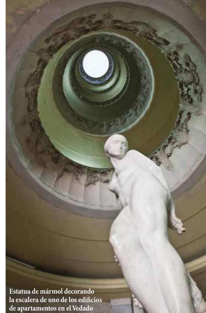
Estatua de mármol decorando la escalera de uno de los edificios de apartamentos en el Vedado