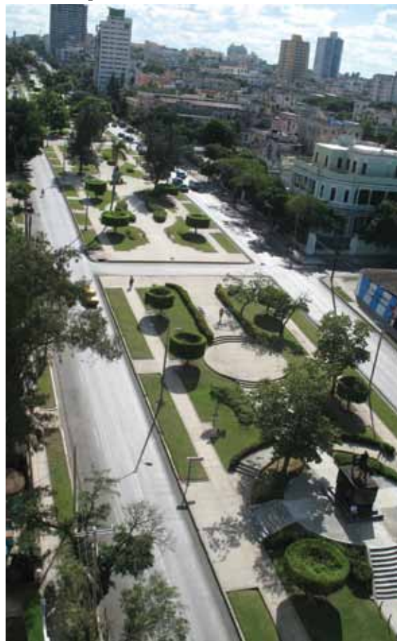
La Avenida de los Presidentes en el capitalino barrio del Vedado

existían tantas muestras de los estilos más importantes del siglo XX. Deseaba lograr algo distinto, pues los libros que existen sobre Cuba siempre muestran el periodo colonial, muebles antiguos o el deterioro de los edificios. Esta es la primera vez que no solo se muestra una residencia, sino su contexto social con historias de las personas que vivieron allí. Otros libros pictóricos muestran simplemente fotos con una pequeña reseña, y otros están dirigidos a la historia arquitectónica exclusivamente, sin tocar el tema de sus residentes, ni lo que éstos vivieron allí. En mi trabajo yo hablo sobre el estilo de vida sofisticado que prevaleció en la Habana desde 1860 hasta 1960, destacando la vida de los artistas, playas, tiendas, cabarets y colegios. A través del libro, llevo al lector a conocer "desde adentro", a esta bella ciudad.